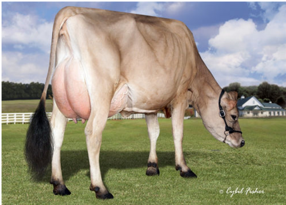
JX RIVER VALLEY CHROME CHERITA 1261 {5}