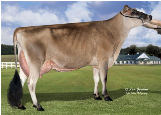
JX RIVER VALLEY DISCO CHERITA 5154 {6}